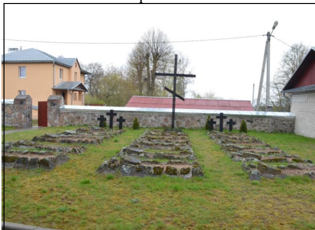
8. Фотоснимок захоронения