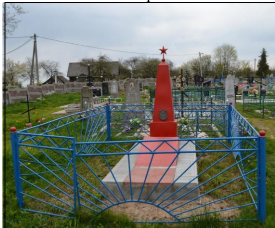
8. Фотоснимок захоронения