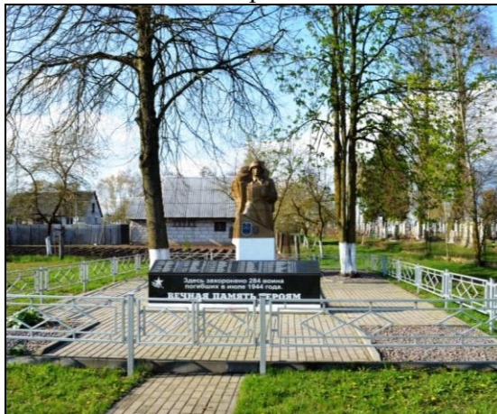
8. Фотоснимок захоронения