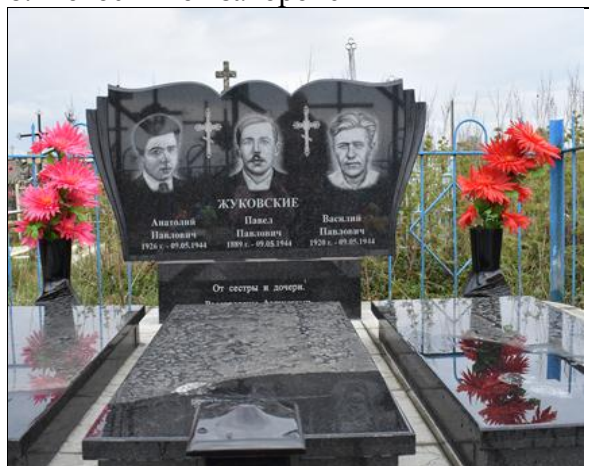
8. Фотоснимок захоронения