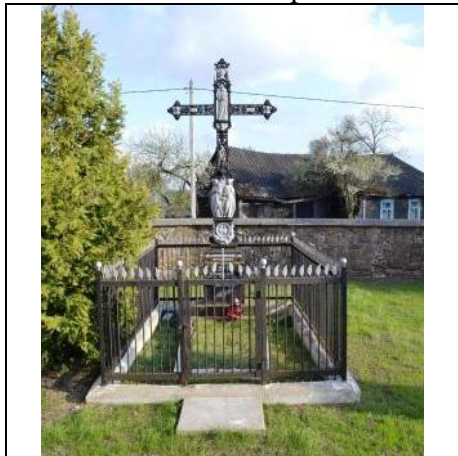
8. Фотоснимок захоронения