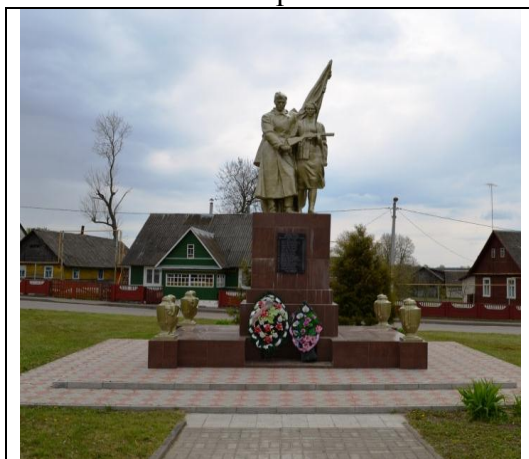
8. Фотоснимок захоронения