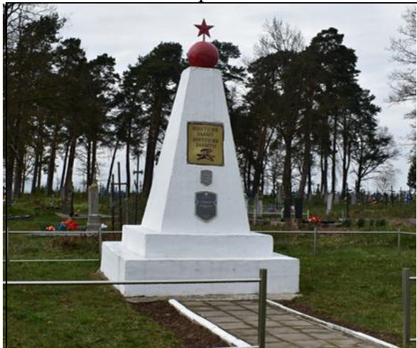
8. Фотоснимок захоронения