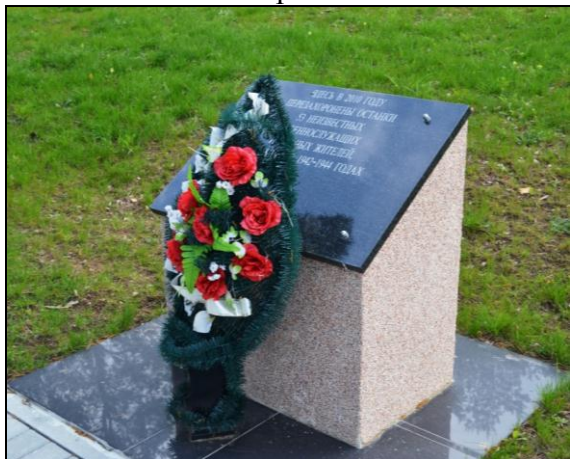
8. Фотоснимок захоронения